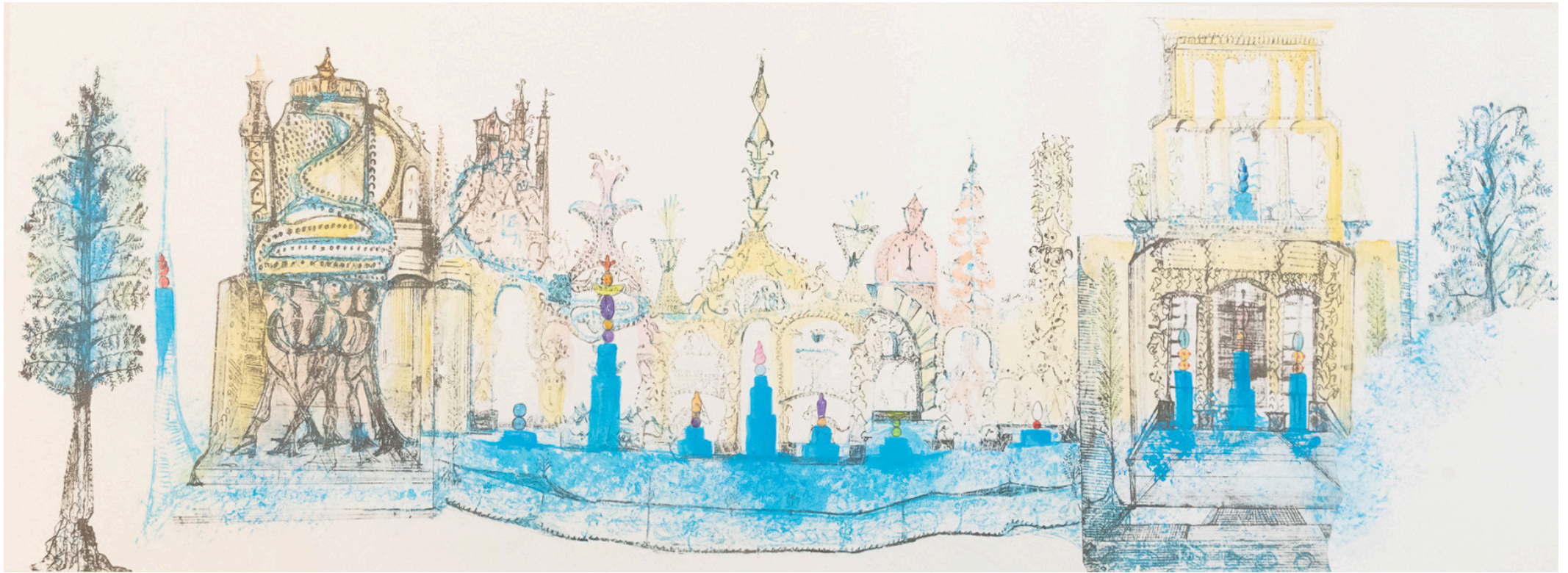
Jean-Michel Othoniel, Projet pour le Palais idéal , Aquarelle sur le dessin préparatoire de Ferdinand Cheval de 1882, Paris, 2022.