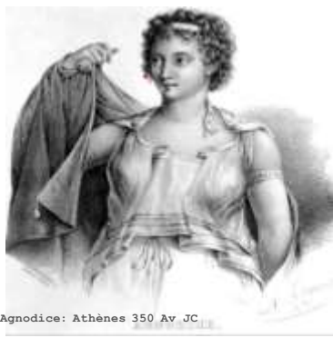
Agnodice: Athènes 350 Av. JC