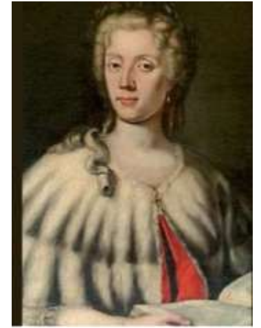
Dorotea Bocchi 1360-14