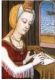
Trotula de Salerne XIIème siècle