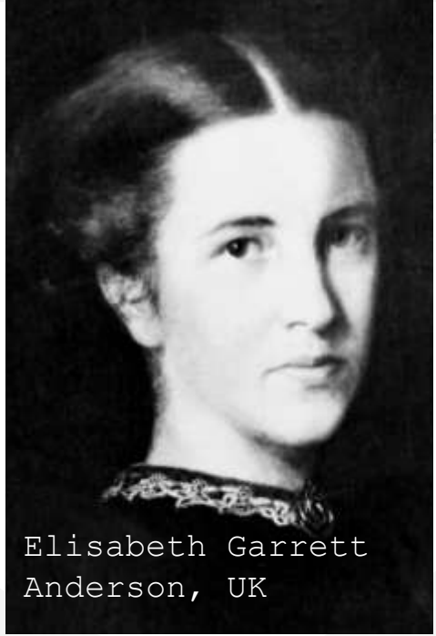
Elisabeth Garrett Anderson, UK