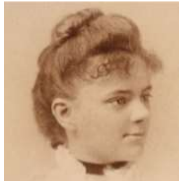
James Barry = Margaret Ann Bulkley (1792-1865)