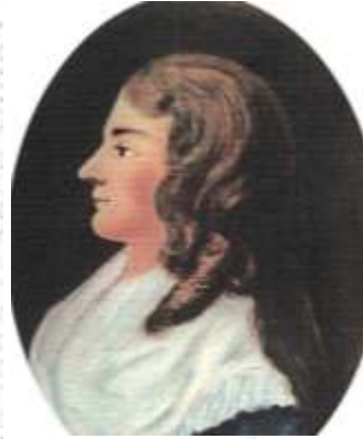
Dorothee Christiane Erxleben (1715-1762)