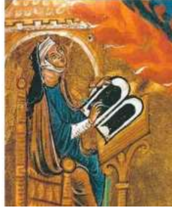
Hildegarde de Bingen 1098-1179