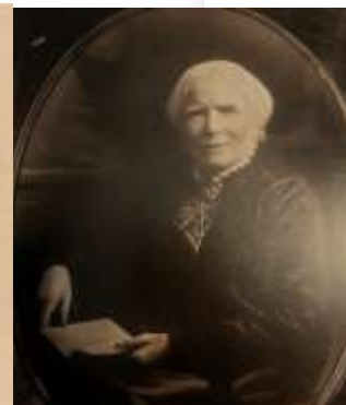
Elisabeth Blackwell (1821-1910) USA