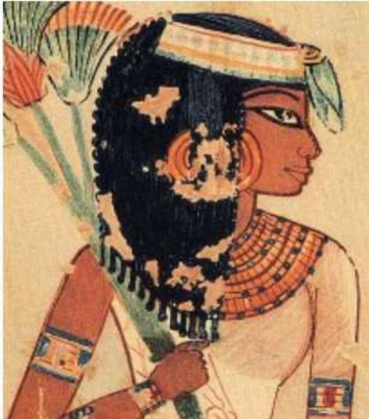
Peseshet= Merit-Path: Ancien Empire Egypte 3000-2263 Av. JC