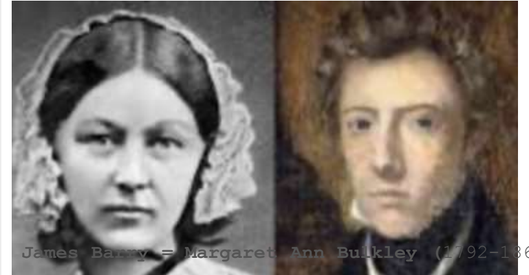
James Barry = Margaret Ann Bulkley (1792-1865) UK

Les premières femmes médecins en Europe et aux Etats Unis