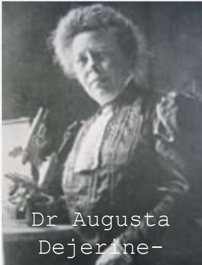
Dr Augusta Dejerine-